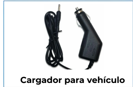
Cargador para vehículo