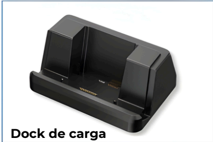
Dock de carga